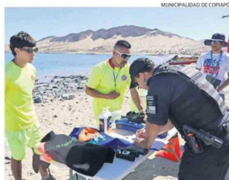
LA PLAYA FUE DECLARADA APTA PARA EL BAÑO.