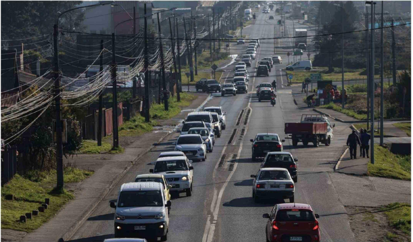
LA RUTA CH-226 QUE UNE PUERTO MONTT CON EL AEROPUERTO EL TEPUAL PASA POR POPULOSOS SECTORES COMO ALTO TEPUAL, PUERTA SUR, MELIHUÉN, LAGUNITAS, CARDONAL BAJO, ENTRE OTROS.