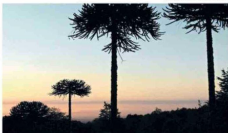
MUNICIPALIDAD DE VILCÚN