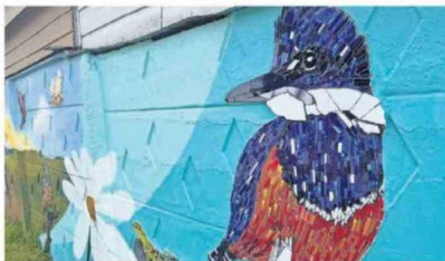
MUNICIPALIDAD DE VILCÚN