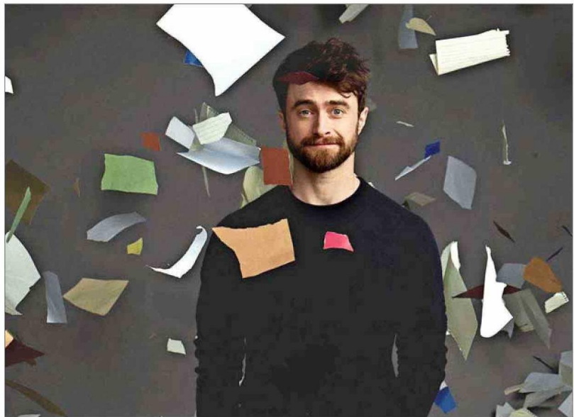
"Every brilliant thing" es el primer unipersonal de Daniel Radcliffe en Broadway.