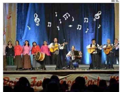
ANTIGUA VERSIÓN DE LA PEÑA COCHE MOLINA