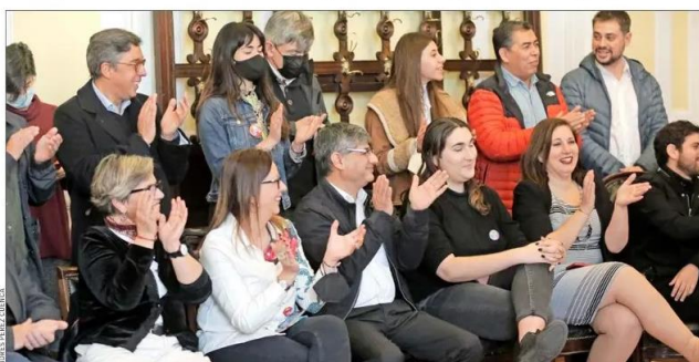
Divididos por un escritorio se mostraron los timoneros de Apruebo Dignidad y el Socialismo Democrático.

"No podemos garantizar que vamos a hacer estas cosas", dijo el presidente del PC aunque el Presidente Boric se comprometió a implementarlas posplebiscito.