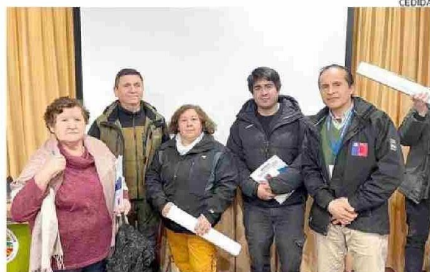
EN EL PARQUE NACIONAL PUYEHUE SE CAPACITA A TODA LA COMUNIDAD.

contagiadas hay en la Región de Los Lagos este año, siendo una cifra más alta que en años anteriores. En general, los casos de Hanta son pocos, pero con alta letalidad.