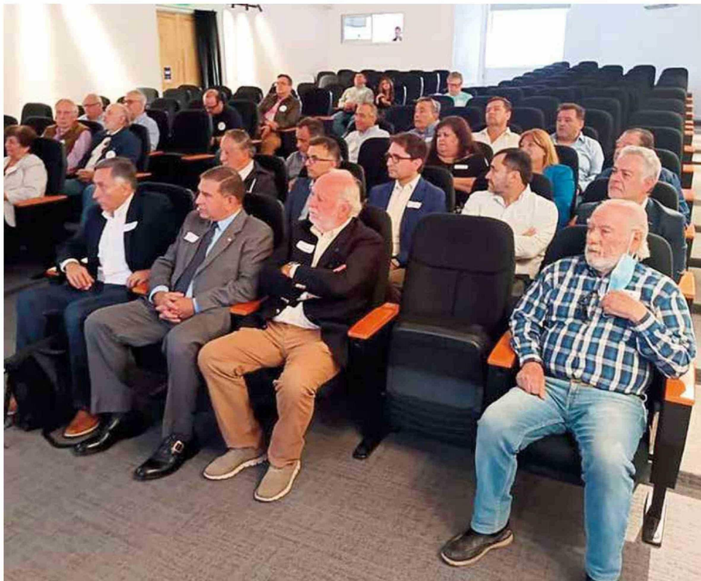
Dirigente espera que las autoridades reciban de buena manera las ideas que un movimiento está afinando para mejorar la calidad de vida de los curicanos en el corto y mediano plazo.

“Aquí hubo un gerente de la CGE que tuvo la intención de hacerlo y si vamos aquí donde está el edificio de los Servicios Públicos hay unas rejillas y ahí iba a empezar eso, pero al final no quedó en nada. Ahora, se han arreglado algunas veredas, pero ahí se debería aprovechar inmediatamente soterrar los cables y después no romper el pavimento de nuevo. Ahí falta visión a futuro”.