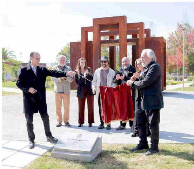
El momento de descubrir la placa fue compartido por el rector de la casa de estudios y el autor de la escultura entre los aplausos de la comunidad.