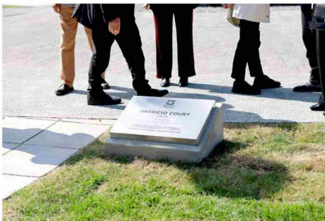
Frente a la estructura, se ubicó la placa que lleva el nombre del autor para recordar en la posteridad dicho momento de inauguración.