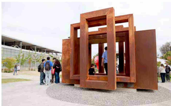
La estructura fusiona la arquitectura y la escultura para brindar un espacio único.