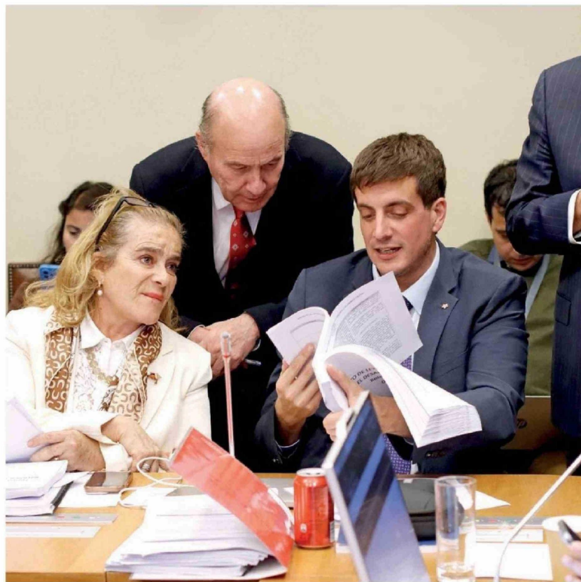
► El ministro de Hacienda, Jorge Quiroz, junto a diputados.

Entre ellos, el que más le dolió fue el rechazo a la idea de eliminar la franquicia tributaria del Sence. A pesar de que el minis-