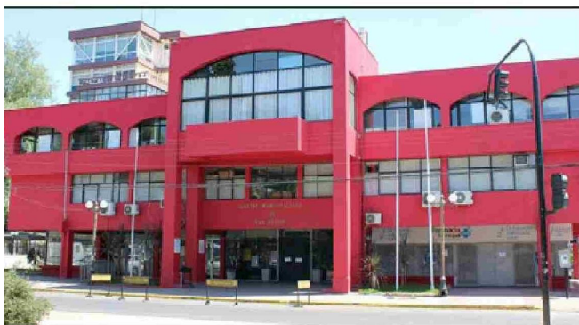
Municipio de San Felipe mantiene millonaria deuda de luz.

«Ahora estamos investigando eso, y como lo he dicho en más de una ocasión, cuando propuse en diciembre el tema de la destitución del administrador municipal, ella se comprometió a hacer un cambio en la gestión. El cambio hasta ahora no se ha visto, yo dije que de aquí a marzo iba a ver si habían cambios o no, y si no, lamentablemente, yo voy a ser uno de los impulsores para llevarla al TER (Tribunal Electoral Regional)», afirmó el concejal.