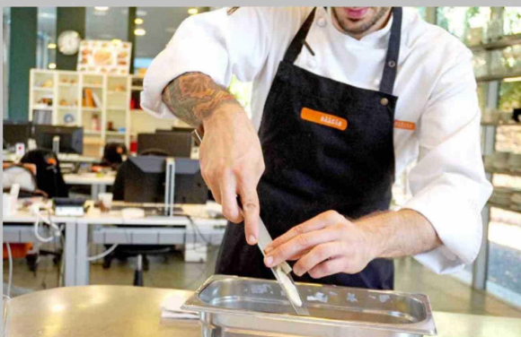
Los cocineros-investigadores de la Fundación Alicia trabajan para mejorar la forma en que dormimos y nos alimentamos, dos facetas interrelacionadas.

"Nuestros hábitos y nuestras decisiones con respecto a los alimentos que ingerimos pueden convertirse en nuestros mejores aliados ayudándonos a dormir