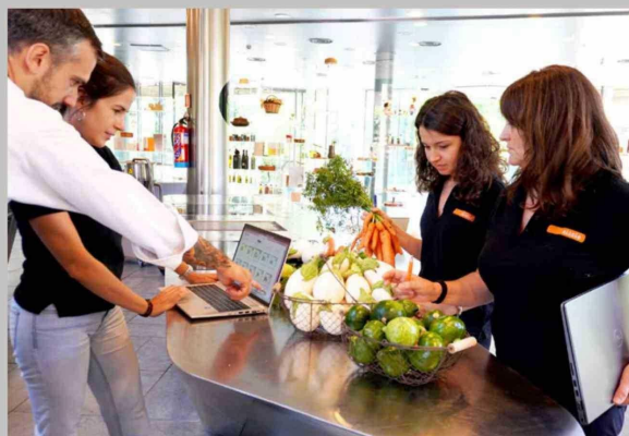
Los especialistas de la Fundación Alicia investigan distintos aspectos de la relación de la alimentación con la salud.

en el café y otras bebidas, provoca una disminución en el tiempo total y la calidad del sueño, así como un aumento en el tiempo de latencia del sueño, mientras que la melatonina, sustancia que transmite al cuerpo información sobre el ciclo diario de luz y oscuridad es inductora del sueño, por lo que los alimentos que la contienen tienen un efecto directo en nuestra manera de dormir, señalan. Por otra parte, lo que comemos puede alterar significativamente la microbiota intestinal (conjunto de conjunto de bacterias y otros microorganismos que viven en el intestino) afectando a su vez la generación de algunos metabolitos (componente nutricionales), necesarios para un buen descanso, de acuerdo a ISAdS y FA. En tercer lugar, los hábitos alimentarios podrían alterar a largo plazo el estado de inflamación del organismo, que también está estrechamente