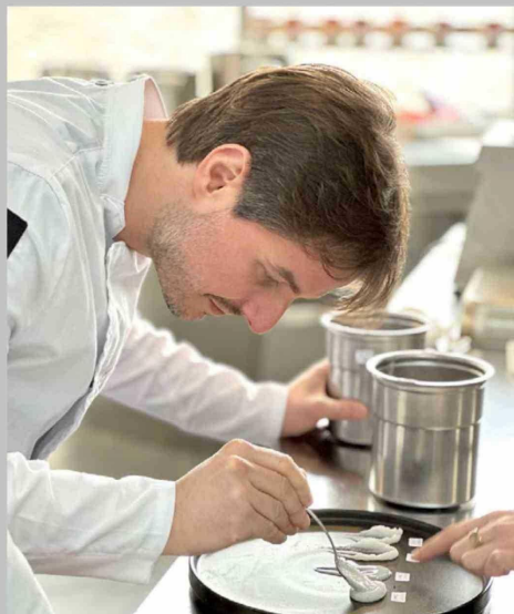
Los chefs de Fundación Alicia experimentan con distintos alimentos, ingredientes y técnicas culinarias saludables.