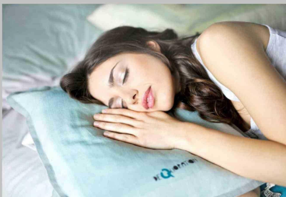
La calidad de nuestro sueño está estrechamente relacionada con la calidad de nuestra alimentación.

Tiraje: 5.000 Lectoría: 15.000 Favorabilidad: No Definida