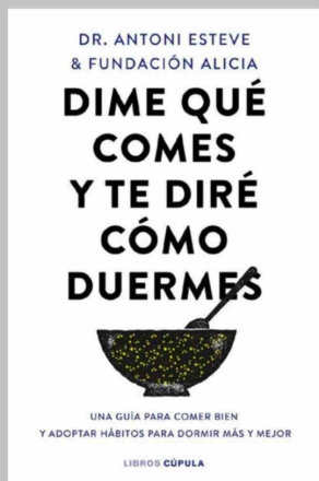
Portada del libro 'Dime qué comes y te diré cómo duermes'.

La Fundación Alicia y el doctor Esteve han publicado el libro 'Dime qué comes y te diré cómo duermes', que explica cómo abordar el insomnio y los trastornos del sueño por medio de pequeños pero importantes