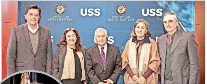
Los exministros de Salud: Pedro García, María Begoña Yarza y Enrique Paris, junto a May Chomali, ministra de Salud, y Osvaldo Artaza, exministro de Salud.

La jornada, realizada en el auditorio del campus Bellavista, contó con la participación de la ministra de Salud, May Chomali, además de exautoridades ministeriales como Enrique Paris, Paula Daza, Osvaldo Artaza, Marcelo Tokman, Evelyn Matthei, Alejandro Andrade y Agustín Romero. También asistieron exparlamentarios, especialistas y representantes de organizaciones de pacientes, quienes compartieron distintas miradas sobre el presente y futuro del sistema de salud chileno.