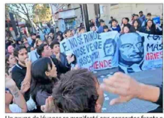
Un grupo de jóvenes se manifestó con pancartas frente a la cartería, en la antesala de la "protesta nacional" convocada por secundarios para este jueves.

Tras reducir quorum de 30% a 20%, estudiantes de la U. de Chile eligen a su nueva federación | C3