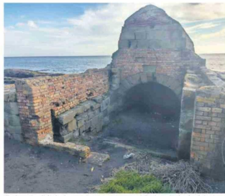
En la actualidad, el espacio presenta un evidente estado de deterioro.

"Una de las principales características de este chiflón es que está