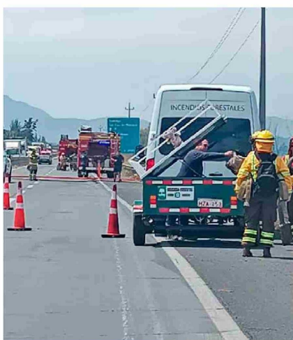
En el Km. 71 de la Ruta Travesía, quedó interrumpido el tránsito vehicular por la gran cantidad de humo que se propagó en la zona.

La emergencia se registró a la altura del kilómetro 71, en Graneros, lo que generó una densa columna de humo negro, originada por la quema de plásticos y químicos en una agrícola, lo que obligó a interrumpir el tránsito en ambas calzadas por la nula visibilidad.