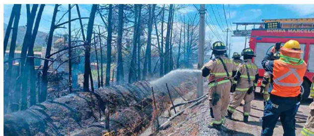
A raíz del incendio gran parte de Graneros quedó sin suministro eléctrico, en la foto se ve como operarios de CGE fotografían un poste quemado.

"Al llegar nos encontramos que la carretera estaba sin visual producto de la gran cantidad de humo, ya que también se vio afectada la empresa Santa Elena. El tipo de material que se quemó generó este humo negro que imposibilitaba el tránsito", señaló el comandante.