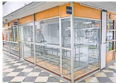
La galería presenta locales vacíos que están impedidos de ser arrendados.

“Se tiene que llegar a un acuerdo. Bienes Nacionales ya desistió del proyecto, y nosotros estamos a la espera de una carta por parte de la inmobiliaria para desistir, pero eso se está alargando y dicen que están haciendo una memoria, pero memoria de qué.”