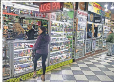
Ventas han caído en 50%. Competencia ambulante y malls chinos inciden.

"Se tiene que llegar a un acuerdo. Bienes Nacionales ya desistió del proyecto, y nosotros estamos a la espera de una carta por parte de la inmobiliaria para desistir, pero eso se está alargando y di-