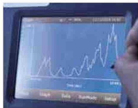
Nefelómetro que mide concentración de material particulado.

CON 20 AÑOS ACOMPAÑANDO A LA MINERÍA, MyMA INTEGRA EXPERIENCIA EN TERRENO, INSTRUMENTACIÓN ESPECIALIZADA Y ANÁLISIS ESTADÍSTICO PARA TRANSFORMAR LA MEDICIÓN DE EMISIONES EN UNA HERRAMIENTA AL SERVICIO DEL DESEMPEÑO AMBIENTAL.