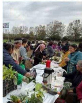
GRAN CONVOCATORIA EN LA ACTIVIDAD.