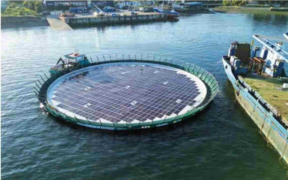
Jaula solar para centros de cultivo.

“Es parte del camino y parte de la ‘revolución azul’, con tener mejores procesos productivos, con poder mejorar nuestra logística, y también en poder trabajar en energías renovables”, Ángela Saavedra, Consejo del Salmón.