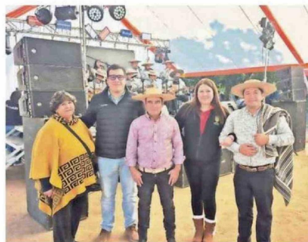
LOS ASISTENTES FESTEJARON LAS TRADICIONES DEL CAMPO.