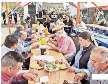
LAS GASTRONOMÍA LOCAL FUE DISFRUTADA POR LOS VISITANTES.