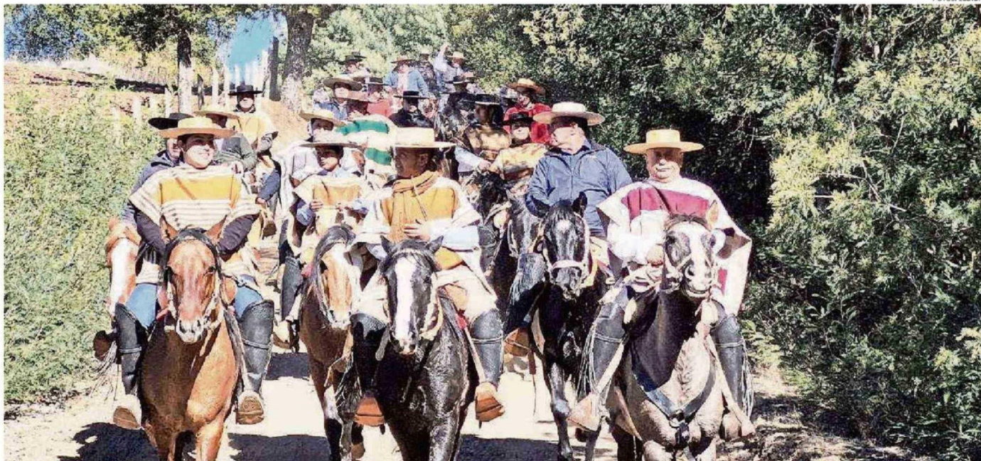
PARTICIPARON JINETES PROVENIENTES DE DISTINTOS SECTORES RURALES DE FLORIDA, ASÍ COMO DE CLUBES DE HUASOS DE LA COMUNA DE QUILLÓN.