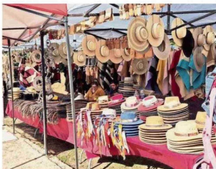
TAMBIÉN HUBO VENTA DE ARTESANÍAS.