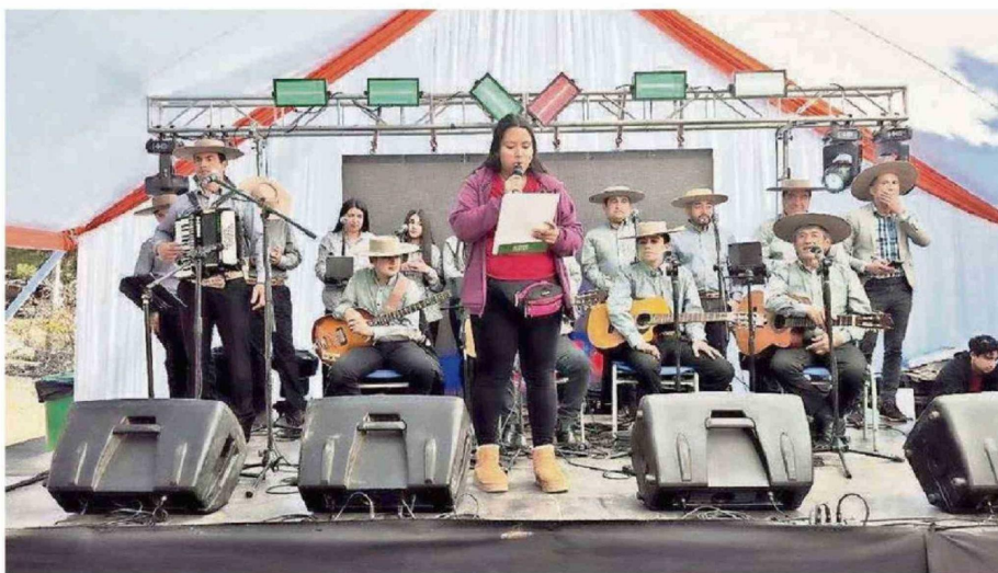
ESTA CABALGATA POR LOS CERROS Y CAMINOS DE TALCAMO BUSCA RESCATAR Y MANTENER VIVAS LAS TRADICIONES DEL MUNDO RURAL.