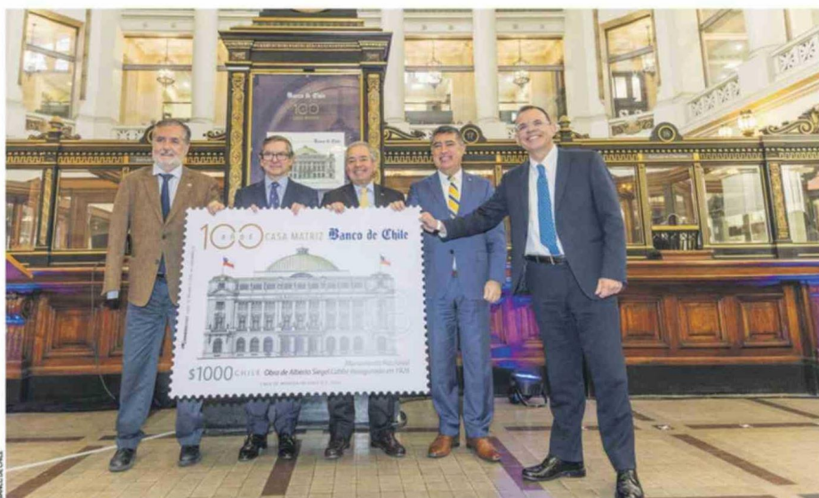
La tradicional ceremonia del matasellado se realizó con la presencia del ministro de las Culturas, el alcalde de Santiago, representantes de Banco de Chile y de CorreosChile.