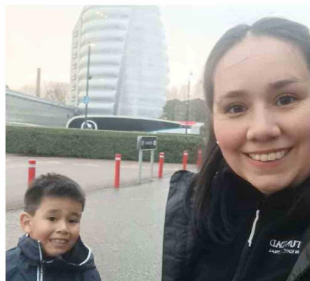
Pudieron recorrer y disfrutar en familia las instalaciones del centro nacional.