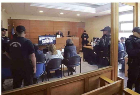
EN LAS PRIMERAS AUDIENCIAS NO HABÍA SEPARACIÓN POR SALAS.

Tras sucesivas postergaciones inició la instancia previa que tendrá una duración de al menos siete días. Luego el juicio se iniciaría en un plazo de 60 a 90 días. Se habilitaron cuatro salas en el tribunal por la gran cantidad de intervinientes.