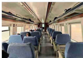
Servicio para la temporada 2026.