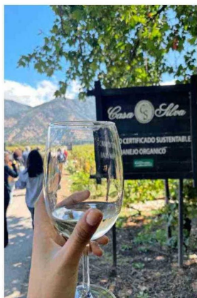
Incluye la copa como regalo.