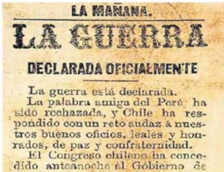
PORTADA DEL DIARIO PERUANO EL COMERCIO, EN ABRIL DE 1879.

Este mes se cumplen 147 años desde que nuestra nación contestara a la declaratoria de Bolivia, involucrando también a Perú. De esta manera inició la Guerra del Pacífico.