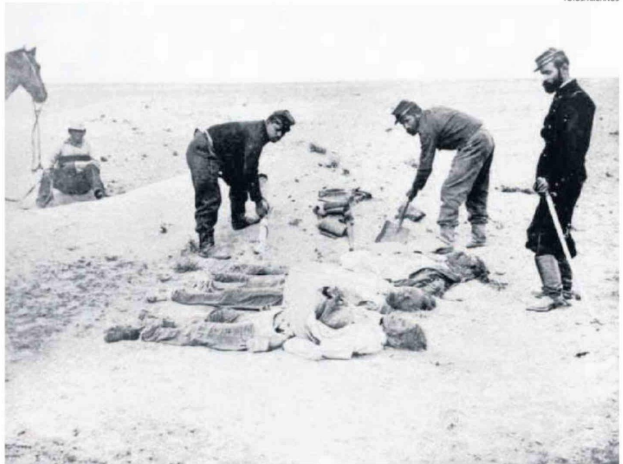
INFANTES CHILENOS SEPULTANDO A SOLDADOS ENEMIGOS CAÍDOS DURANTE LA BATALLA DEL ALTO DE LA ALIANZA, EN MAYO DE 1880.

Durante estas tratativas ocurrieron dos sucesos. Estos fueron el primer enfrentamiento armado entre los países beligerantes el 23 de marzo de 1879 en la localidad de Calama (combate de Topáter), y el descubrimiento por parte de diplomáticos chilenos que Perú tenía un tratado secreto de alianza con Bolivia en caso de guerra con Chile. Tras esto, el gobierno chileno bajo la administración del presidente Aníbal Pinto desestimó los esfuerzos de paz de Perú (gobernado por Mariano Ignacio Prado), conminando a renunciar a este tratado.