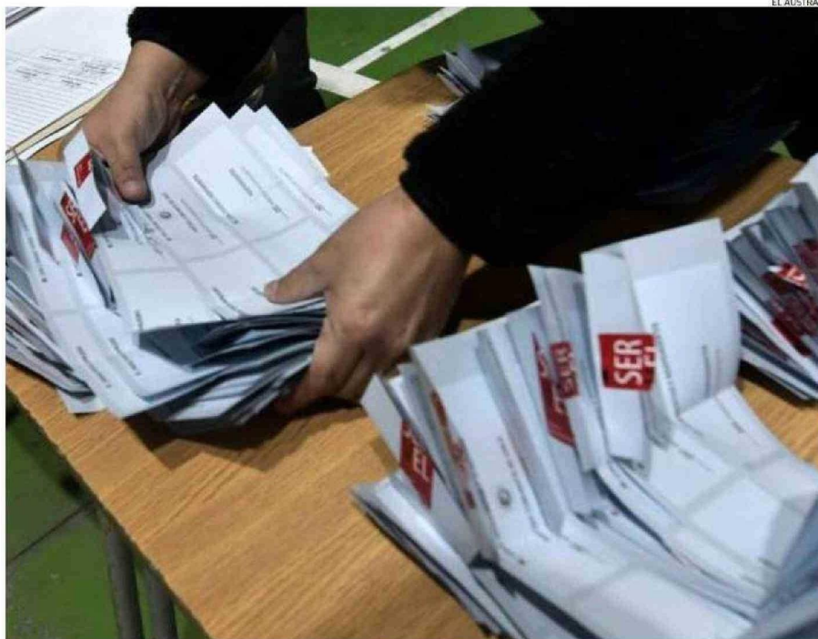
LAS VOTACIONES SERÁN EL 27 DE OCTUBRE DE 2024. EN ELLAS SE ELEGIRÁ A LOS ALCALDES, CONCEJALES, CONSEJEROS REGIONALES Y GOBERNADOR.

Estas elecciones municipales son las primeras de este tipo con voto obligatorio, con un padrón electoral provincial de 215.792 personas mayores de 18 años, los que están validados por el Servicio Electoral (Servel) para sufragar. Osorno