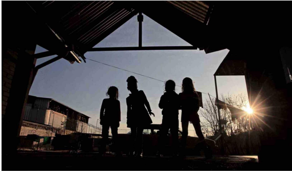
La comisión se creó a fines de 2024 y tiene por objetivo esclarecer las violaciones a los derechos humanos de niños y adolescentes bajo custodia del Sename o en sistemas de cuidados alternativos privados entre 1979 y 2024.

“No se trata de una discusión presupuestaria: cuando se desarticulan dispositivos especializados bajo criterios administrativos, se altera su sentido. Cuando se limita la autonomía de una Comisión de Verdad, se compromete gravemente su capacidad de cumplir su mandato”, precisan, aunque dicen confiar en que el Estado de Chile sa-