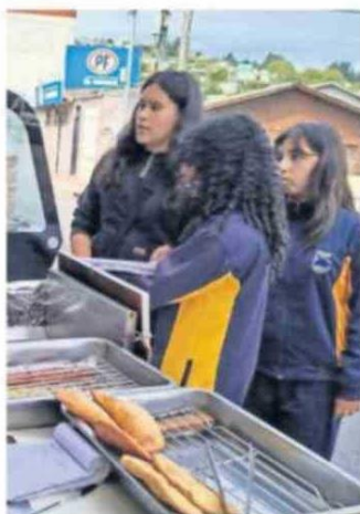
Alumnos dirigieron sus cortos.

El apoyo recaudado será canalizado mediante la docente, quien afirmó que entregará los fondos a la asistente social de la escuela. Así, posteriormente, se decidirá en conjunto los siguientes pasos en ayuda de los niños. Contó además que adquirieron mochilas y útiles escolares y se está gestando la idea de una sala de contención.