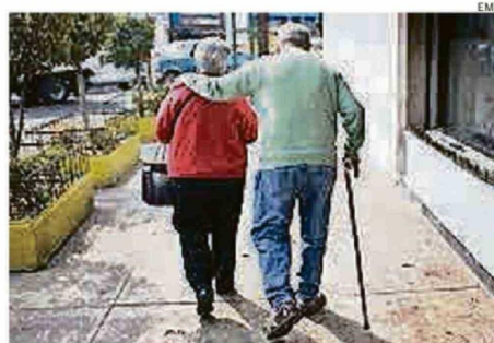
UN INFORME DEL INE REVELÓ QUE 15 DE LAS 21 COMUNAS DE ÑUBLE REGISTRAN ACTUALMENTE MÁS DEFUNCIONES QUE NACIMIENTOS

La situación regional se da en medio de un escenario histórico para Chile que me revela que durante 2025 el país alcanzó por primera