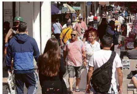
ADÉMÁS DE AMBULANTES, LOCATARIOS EXIGEN SEGURIDAD POR ROBOS.

En su caso, su local se encuentra un poco más alejado de los extremos de la Avenida Valparaíso, y afirmó que se ha visto "más contingente municipal y de carabineros, más seguridad, y si resultó, porque no se han puesto tantos ambulantes, por lo menos en esta cuadra; pero sigue sí el grupo que se pone allá en la otra cuadra (cercana a la plaza). Ese grupo no lo han podido sacar. De hecho, la semana pasada tam-