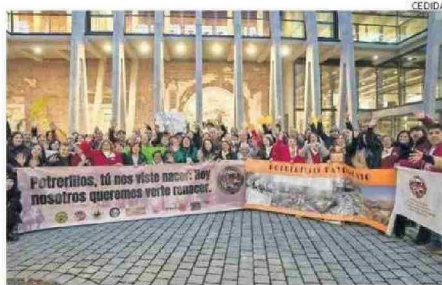
LOS POTRERILLANOS ESTÁN MUY FELICES CON LA NOTICIA.

menakis agregó que “este reconocimiento, es sin duda, un acto de justicia patrimonial e histórica, que pone en valor no solo una riqueza arquitectónica y urbana, sino que también la memoria de quienes dieron vida a este emblemático enclave minero que albergó a más de siete mil trabajadores y sus familias en su apogeo. Como seremi de las Culturas, las Artes y el Patrimonio, celebramos este resultado, fruto del esfuerzo y la perseverancia de muchas personas, agrupaciones de potrerillanos y potri-