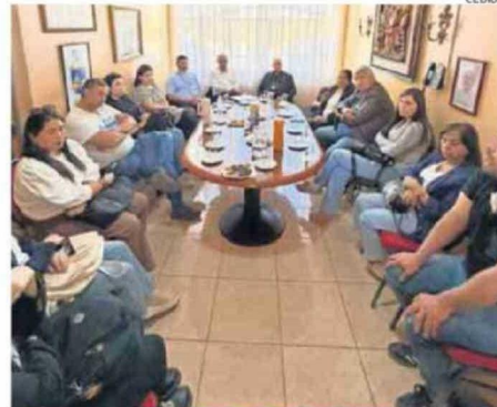
PRIMER ENCUENTRO DE COMUNIDAD ESCOLAR CON EL SOSTENEDOR.

Entre las cuales figura colaborar en el fortalecimiento de los canales de comunicación del establecimiento. También se propuso transformar el lugar en donde ocurrieron los hechos en un espacio de reflexión, como de igual manera mejoras estructurales, y seguridad, con la construcción de nuevos baños, cierre de rejas en el nivel básico, y modificación de ingreso a los estudian-