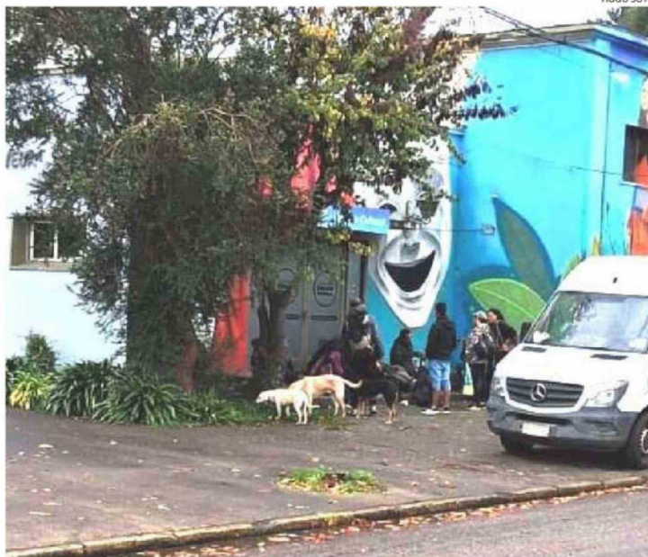
CASI UNA DECENA DE PERSONAS COMPARTEN CON SUS PERROS A LAS AFUERAS DE LA BIBLIOTECA Y CENTRO CULTURAL GALO SEPÚLVEDA, EN AVENIDA BALMACEDA, UNO DE LOS NUEVOS PUNTOS "OCUPADOS".

Las locatarías aseguran que utilizan esta infraestructura techada como casa ante la falta de albergues.