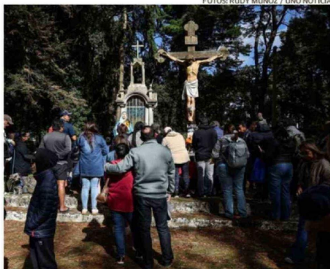
CIENTOS DE PERSONAS LLEGARON AL CERRO CALVARIO DE PUERTO VARAS.

El resguardo policial permitió que las 14 estaciones se desarrollaran sin contratiempos, cerrando la jornada sin reportar incidentes ni accidentes. c3