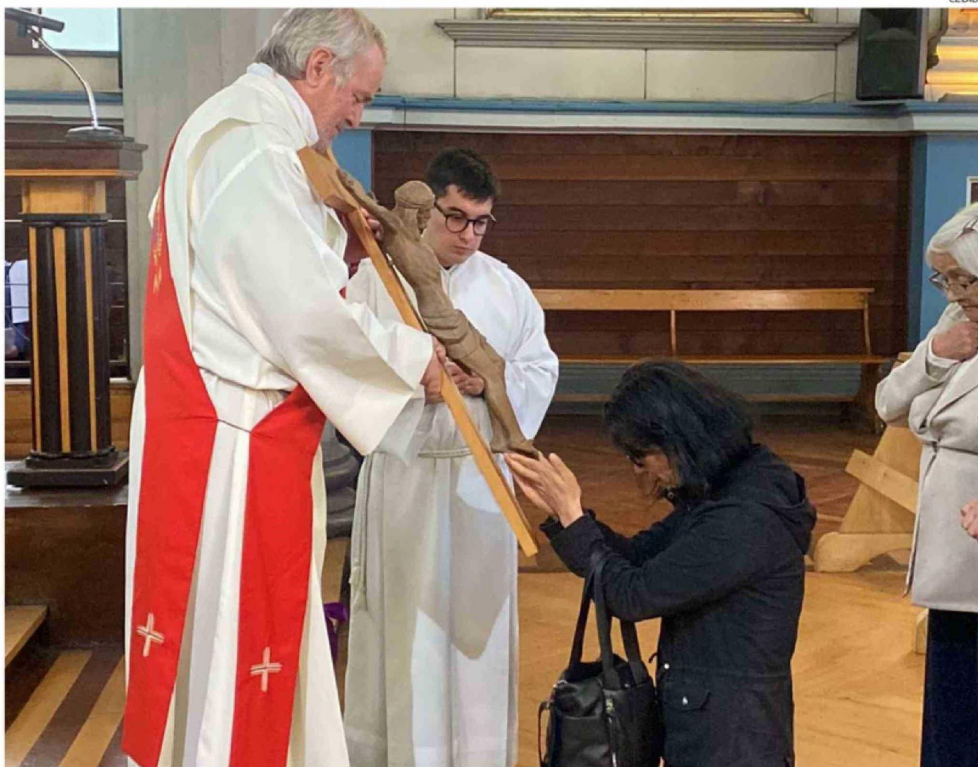
EN LA CATEDRAL DE PUERTO MONTT SE REALIZÓ AYER EN LA TARDE LA CELEBRACIÓN DE LA PASIÓN. MAÑANA SERÁ LA MISA DE RESURRECCIÓN.

de hoy sábado se ha programado el inicio de la Vigilia Pascual en el principal templo católico de Puerto Montt.