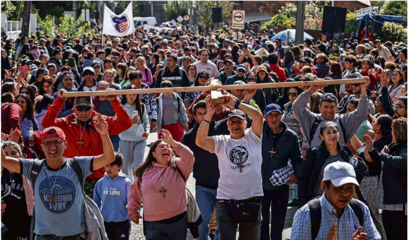
LA EXTENSA CAMINATA DE CERCA DE 25 KILÓMETROS COMENZÓ ALREDEDOR DE LAS 6 DE LA MAÑANA POR LA RUTA V-505. EL ARRIBO A PUERTO VARAS FUE PASADO EL MEDIODÍA.