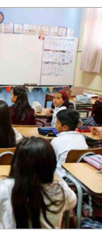
Según los directores, los colegios encaran desafíos que van más allá de los contenidos pedagógicos o incluso de la violencia que afecta a parte del sistema.

Al respecto, el titular presidente del Consejo de la Agencia de Calidad de la Educación plantea que "la disrupción de la tecnología ha encontrado un sistema escolar inmaduro en cuanto a marcos pedagógicos, regulatorios y normativos que permitan restringir y orientar el correcto uso de esta para fines educativos".