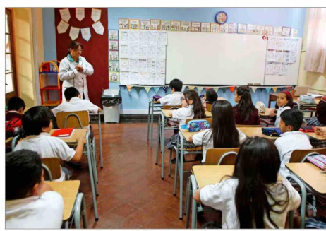
Según los directores, los colegios encaran desafíos que van más allá de los contenidos pedagógicos o incluso de la violencia que afecta a parte del sistema.

del Saint George's College, también enumeró varios de esos elementos: "Hoy, los colegios enfrentamos desafíos mucho más complejos que hace algunos años. El impacto de las redes sociales, el aumento de problemas de salud mental en niños y adolescentes, la sobreexposición digital, la violencia en distintos espacios y la dificultad para construir vínculos sanos nos obligan a asumir un rol cada vez más activo y preventivo".