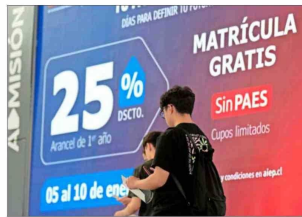
La gratuidad se otorga a quienes acreditan pertenecer al 60% más vulnerable de la población. Más de 625 mil personas estudian hoy con el beneficio.

También destaca que "la mayoría de esta información proviene de registros administrativos que no dependen de lo que el postulante declara, lo que le otorga al modelo una objetividad que los mecanismos anteriores no tenían".