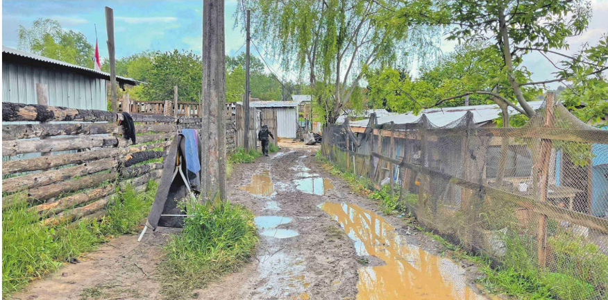
El campamento los Pirquenes de Coronel expuso la precariedad de lo que es vivir en estos asentamientos.