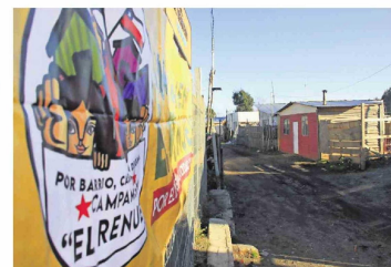
El Minvu espera, al menos, frenar las cifras al alza.

Por lo mismo, advierten que se deben mirar las causas que llevan a las personas a vivir en asentamientos informales y que lo lamentable es que esta problemática que se arrastra hace años como país tiene consecuencias desastrosas, "como las tragedias que hemos visto en los últimos días —en Coronel, por ejemplo—, y vemos con preocupación que estamos llegando demasiado tarde". Según la fundación, en la Región se crearon 114 campamentos desde 2010, de los 198 existentes hoy. Un total de 38 surgió a contar de 2020.