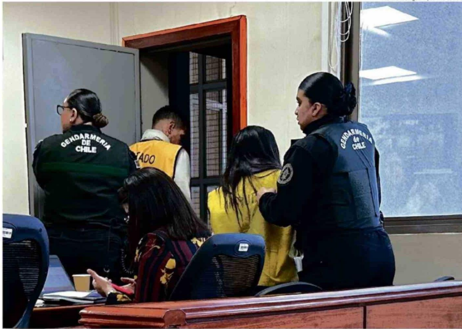
LOS IMPUTADOS DE 25 Y 26 AÑOS ENFRENTAN UN JUICIO ORAL. LA FISCALÍA SOLICITA QUE SEAN CONDENADOS A CADENA PERPETUA.

Posteriormente, a eso de las 4.40 horas, los imputados junto a la menor de edad, se dan a la fuga del domicilio con especies sustraídas (consistentes en dinero y artículos de valor), dirigiéndose al terminal de buses de la comuna de San Antonio y en un viaje sin detenerse abordan un bus en (el terminal) San Borja de la Región Metropolitana, rumbo al terminal de Arica,