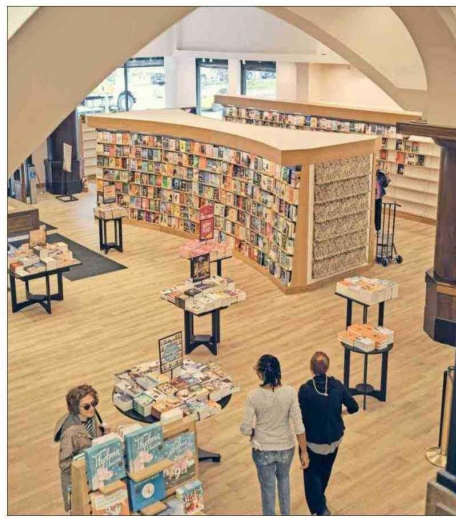
Las tiendas de la compañía han sido remodeladas en los últimos años.