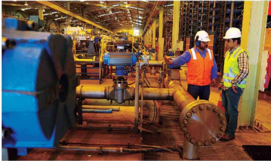
LA REGIÓN DE ANTOFAGASTA ES LÍDER EN DESALINIZACIÓN EN LATINOAMÉRICA, CON 13 PLANTAS OPERATIVAS.

"Actualmente Antofagasta es la región que lidera la capacidad de producción, con 6.985 litros por segundo (l/s). Sumando todos los proyectos, la región podría sumar 21.200 l/s".