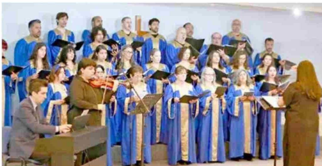
El Coro Universidad Católica del Maule fue el encargado de abrir el acto académico de Inauguración Año 2025.