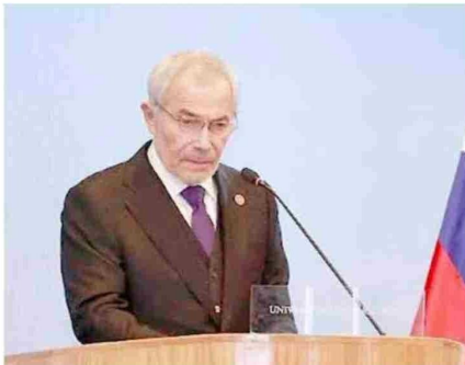
Mensaje del rector a la comunidad, dónde dio énfasis en el importante momento de crecimiento interno en el que se encuentra la casa de estudios.