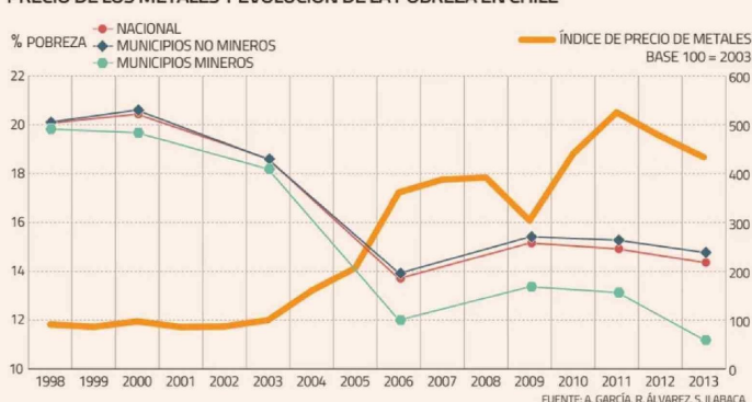
PRECIO DE LOS METALES Y EVOLUCIÓN DE LA POBREZA EN CHILE

minería cayó al 12% en promedio", detalla.