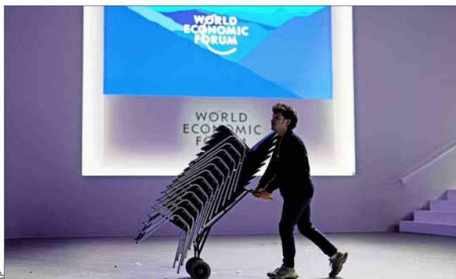
El encuentro anual en la ciudad suiza de Davos finalizó este viernes. Fue organizado por el Foro Económico Mundial (WEF, por las siglas en inglés).

Ella es la presidenta del Banco Central Europeo, ex directora gerente del FMI, una de las mujeres con mayor reputación/poder en el planeta, y se dice que será la futura presidenta del WEF. Al final de un día hubo una sesión de "música y conversación" con Yo-Yo Ma, y la Sra. Lagarde era una de los tres amigos invitados a conversar. Des-