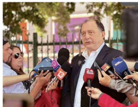
PODUJE ORDENÓ EL CESE DE FAENAS CON CONSTRUCTORA.

Respecto a las 52 casas que se encuentran finali-