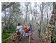
Parque Nacional Fray Jorge.