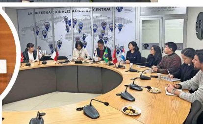
El seminario interno "Perspectivas de investigación sobre autoritarismo y movimientos sociales".