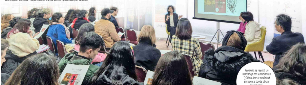
También se realizó un workshop con estudiantes "¿Cómo leer la sociedad coreana a través de su literatura?".