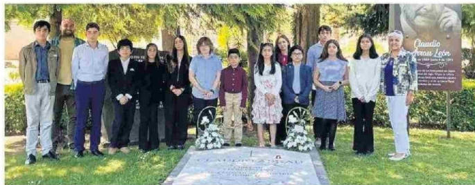
Estudiantes visitando la tumba de Claudio Arrau en Chillán.

-Ahí hay una gran diferencia. Puede haber muchos instrumentistas de cuerdas, vientos, percusión, pero no transmiten. Hay gente maravillosa que toca y uno les admira todo, pero no comunican mucho. Cuando tocas con el alma, interpretas y entiendes todo lo que hay detrás de esas pelotitas y figuras en el pentagrama, el resultado es notable.