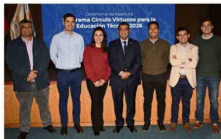
Equipo de Codelco División Ventanas.