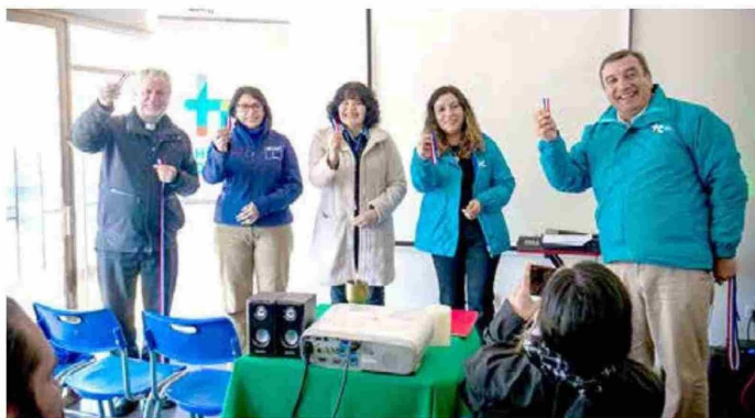
Autoridades destacaron la importancia de contar con este centro para las personas en situación de calle.

Apoyo. El programa de la Seremi de Desarrollo Social y Familia ha logrado brindar más de 12.500 prestaciones para 500 rut diferentes durante el primer semestre de este año.