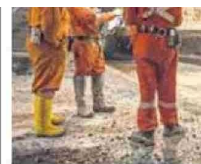
BAJÓ 2,5 PUNTOS RESPECTO A 2025.

proyecto en El Abra se estiman en aproximadamente 17.500 millones de libras de cobre, lo que lo posiciona como uno de los principales proyectos de crecimiento futuro de la compañía, precisaron.